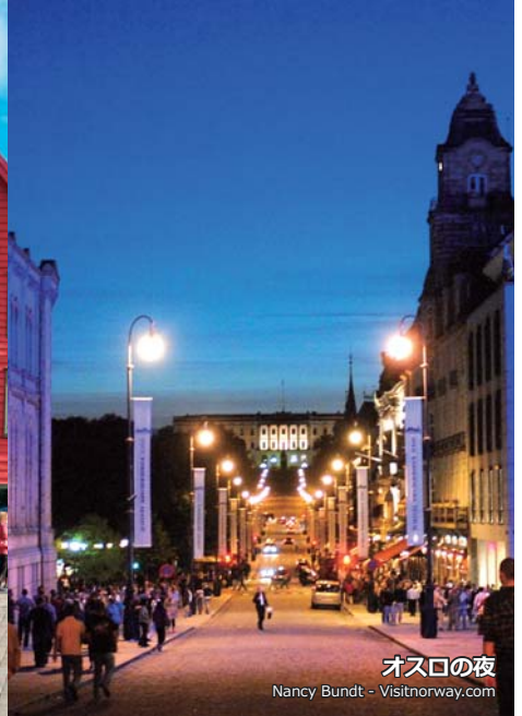
オスロの夜

日本グリーグ協会の後援をいただき、ノルウェーの2つの音楽祭とノルウェーの誇る音楽家グリーグゆかりの地を巡るツアーを実施いたします。