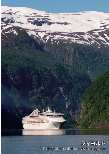
フィヨルド Terje Rakke Nordie life - Visitnorway.com