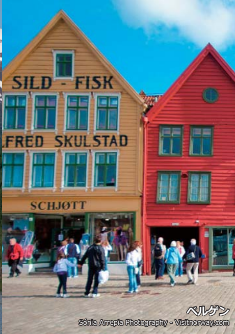
ベルゲン