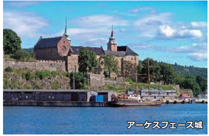
アーケスフェース城