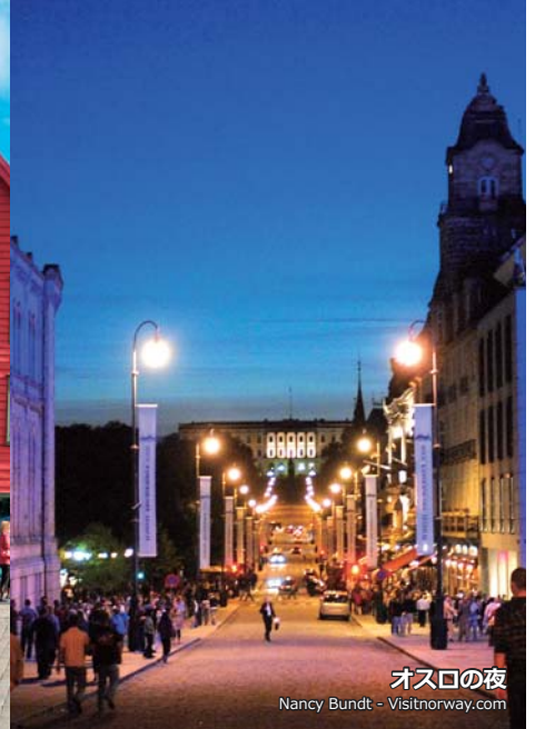
オスロの夜

日本グリーグ協会の後援をいただき、ノルウェーの2つの音楽祭とノルウェーの誇る音楽家グリーグゆかりの地を巡るツアーを実施いたします。