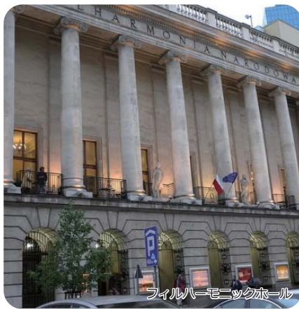
Fryderyk Chopin Music Hall