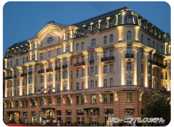
ポーランドクラシカルホテル