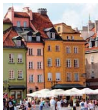
観光客でにぎわう王宮広場