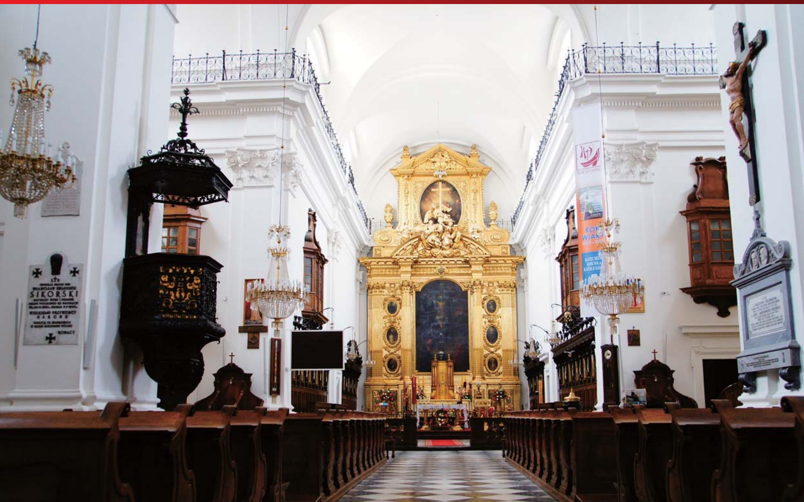
ショパンの心臓が眠る聖十字架教会内。

5年に1回行われるフレデリック・ショパン国際ピアノ・コンクール鑑賞がセットになりました。 コンクール会場からも徒歩圏のホテルにご滞在できるプランです。