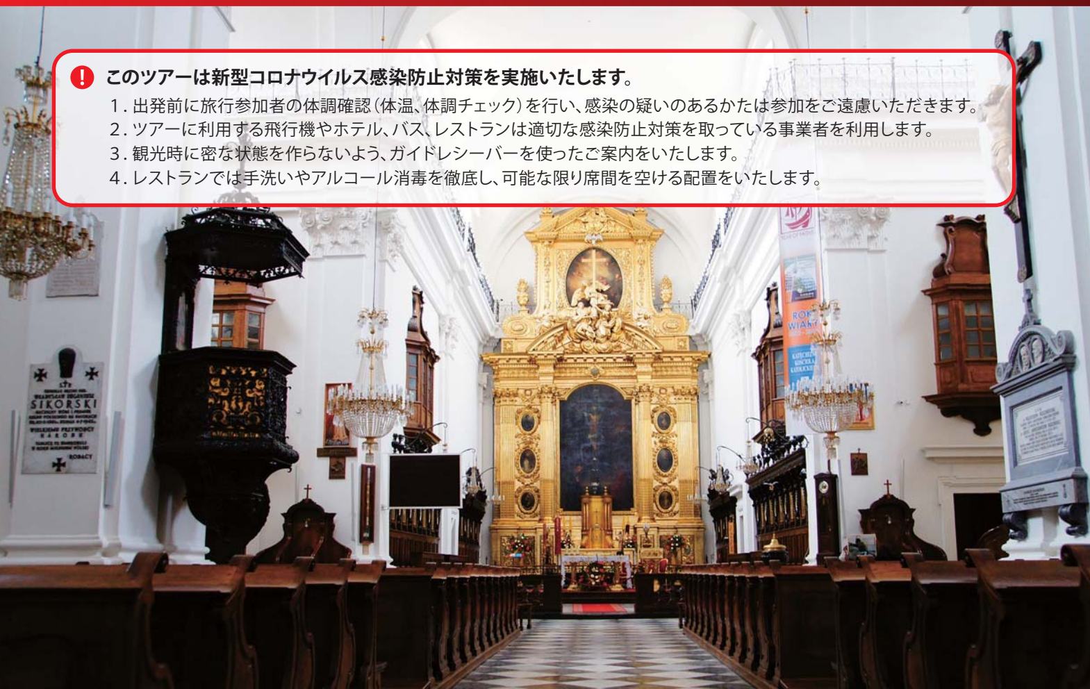
ショパンの心臓が眠る聖十字架教会内。