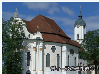
ウィースの巡礼教会

ロマンチック街道とノイシュバンシュタイン城、 さらにライン川下りと ドイツ南部の有名観光地を網羅！ 大型観光バスを使ってゆったりと 観光コースを巡ります。