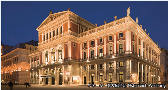
ウィーン・楽友協会