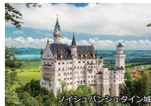
ノイシュバンシュタイン城