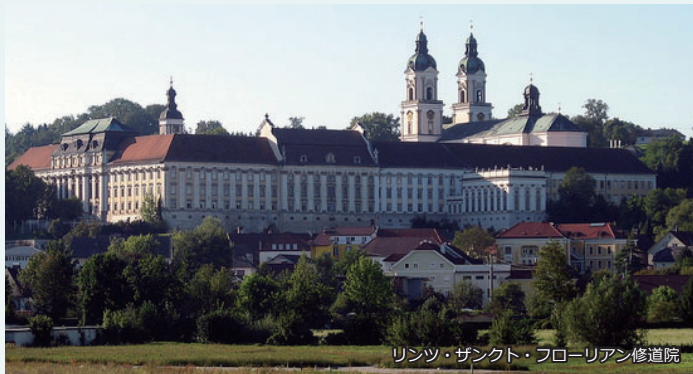
リンツ・ザンクト・フローリアン修道院